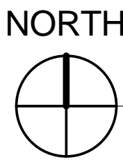
TOP LEVEL DRAINAGE PLAN