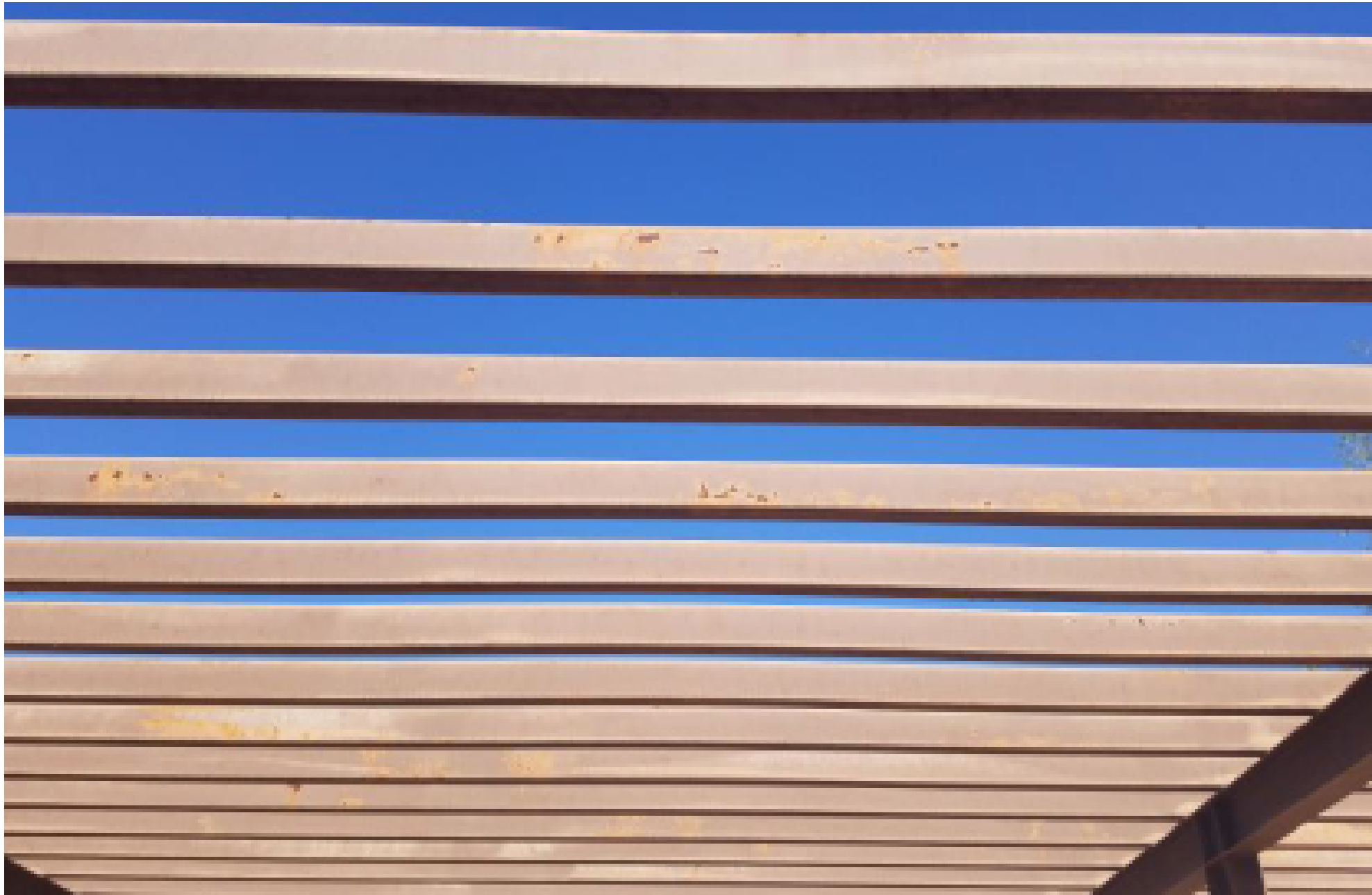
PERGOLA - TYPICAL CONDITION