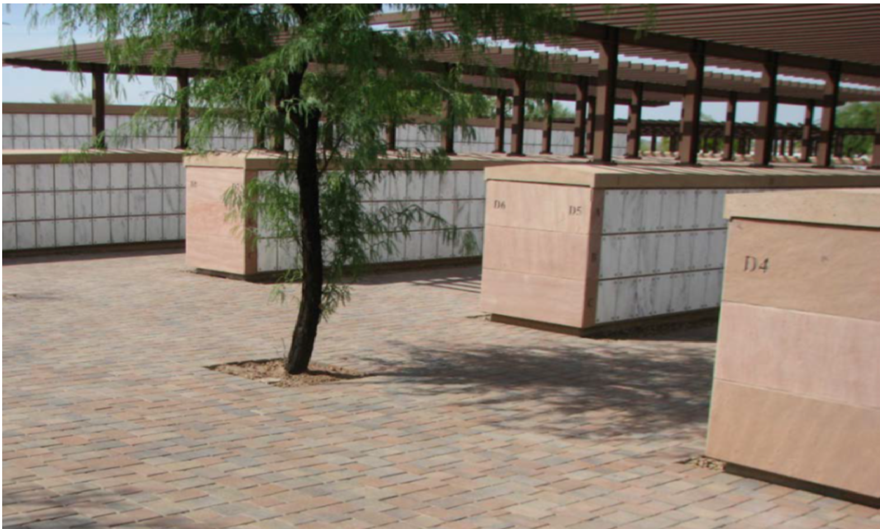
TYPICAL COLUBARIUM COURT